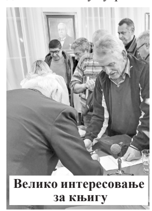
Велико интересовање за књигу

поглављу осим стручног дела описани су сусрети и