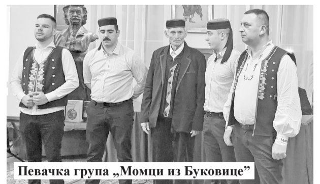
Певачка група „Момци из Буковице“